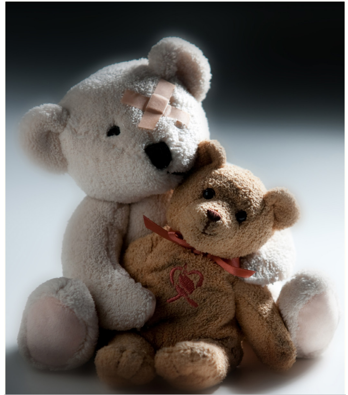
Frykter mørketall selv om Statens Barnehus i Bodø har gjennomført 27 flere avhør i 2020 sammenlignet med i 2019.

Politiet bekymrer seg for at mørketallene trolig har økt på dette området i perioden hvor mange barn har hatt mindre kontakt med andre. Dette bedret seg dog etter at skoler og barnehager startet opp igjen etter sommerferien.