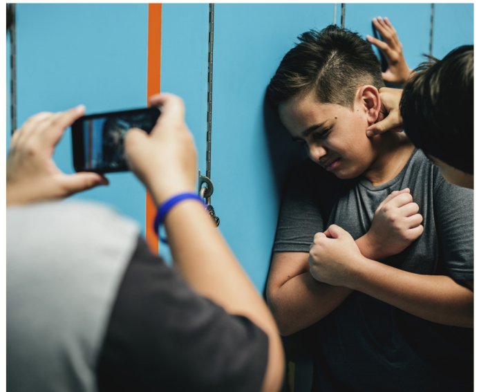
Det har i 2020 vært en økning i antall anmeldte saker hvor gjerningspersonen er under 18 år.

Anmeldte saker hvor gjerningspersonen er under 18 år, har økt med 15 % i 2020. Økningen er størst innenfor kategorien "annen" som blant annet inkluderer trafikk saker, men i tillegg ser vi en økning i saker knyttet til kategoriene sedelighet (økning med 24 %), vold (økning med 19 %) og skadeverk (økning med 17 %). Det er en nedgang i kategorien narkotika med 17 %.