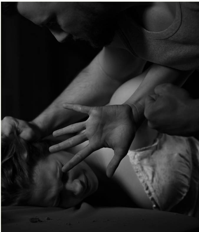
Politiet mener nedgangen i voldtektssaker er knyttet til en reduksjon i antall festvoldtekter.

Når det gjelder oppklaringsprosenten på dette området har den økt med 3,2 % siste året, og er i 2020 på 39,6 %. Det er også positivt å se at saksbehandlingstiden er redusert med 25,8 % i 2020.