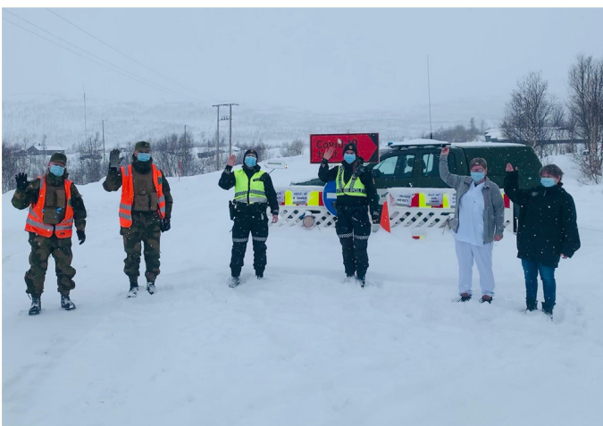
Grenseoppdraget har vært et krevende arbeid som politiet, selv med ekstra ressurser ikke hadde kunnet gjennomføre uten de gode samarbeidspartneren.

Det er registret 143.037 innpasserte/kontrollerte personer ved grenseovergangene i Nordland politidistrikt i 2021.