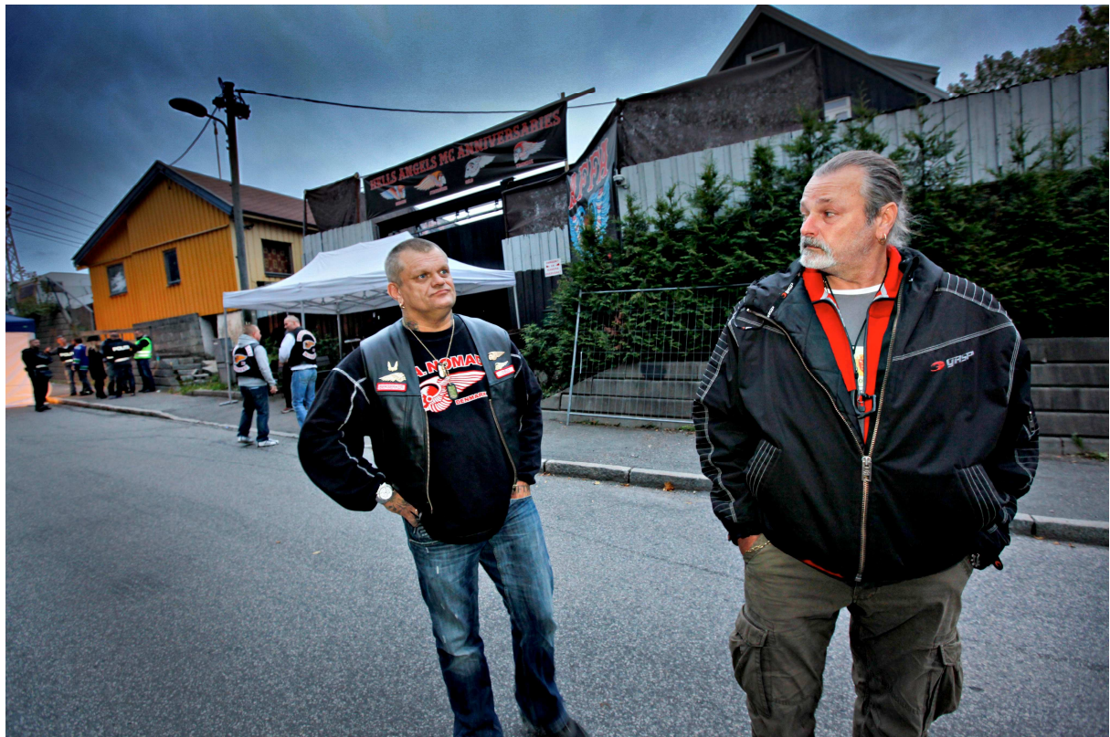
Dialog under Euro officer-meeting med president HA, Oslo 2011.