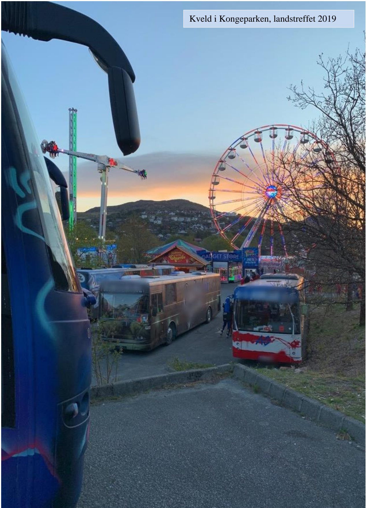
Kveld i Kongeparken, landstreffet 2019