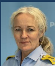
Januar 2025 Politimester Cecilie Lilaas-Skari

Like viktig som samarbeid om kunnskapsgrunnlaget, er samarbeid om innsatsen og bekjempelsen. Politiet kan ikke forebygge og bekjempe kriminaliteten alene. Samfunnet er avhengig av at alle bidrar til å redusere sårbarheter, beskytte enkeltindividet, sikre verdier, dele informasjon, samt avdekke og håndtere hendelser og trusler. Det er bare gjennom et forpliktende samarbeid og samspill vi klarer å motvirke fremvekst og uønsket utvikling av kriminalitet.