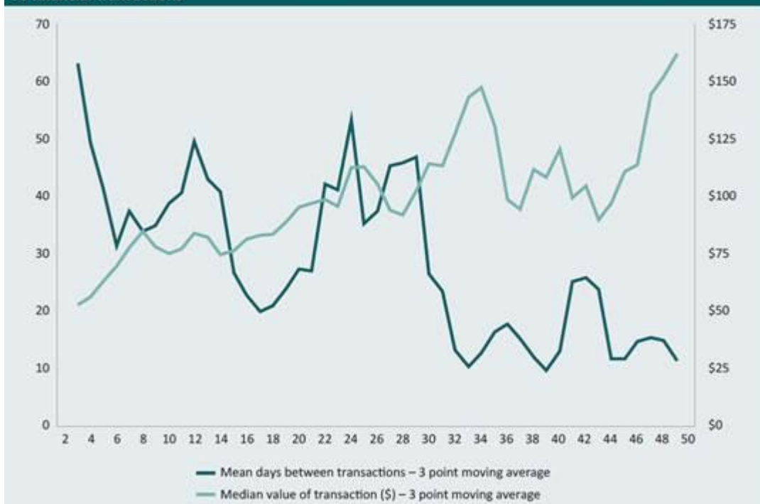
Figure 4: Mean number of days between CSA live stream transactions and median value of first 50 financial transactions

Under følger et eksempel på chat som illustrerer hvordan selger forteller om en hendelse i hverdagen, i dette tilfelle en syk onkel som har kommet på sykehus. Selger ønsker at kjøper skal sende penger for å betale for sykehusoppholdet. I chatten fremkommer det at kjøper og selger kjenner hverandre, da kjøper allerede har fått informasjon om at onkelen er på sykehus via en annen person.